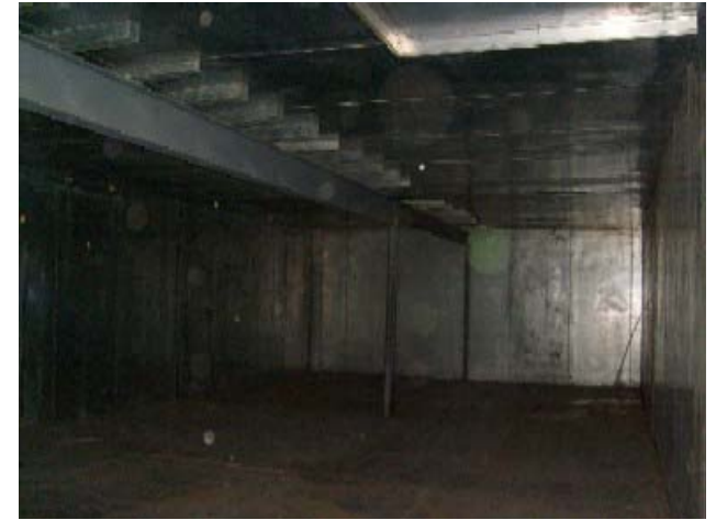
23'1" x 88'3" x 9'6" H Walk-In Freezer with Floor